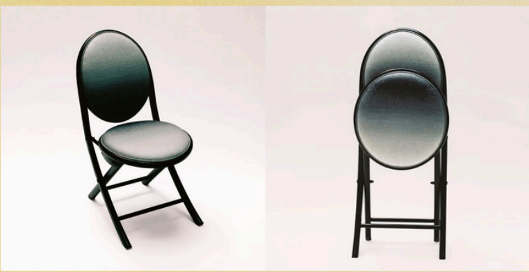
Constance与Dior合作将经典的Medallion Chair重新设计成为一把折叠椅。