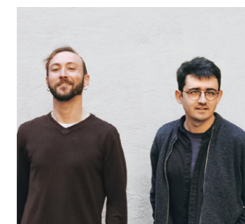
OIKO DESIGN OFFICE