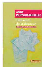
Puissance de la douceur , d'Anne Dufourmantelle, Éditions Payot et Rivages, 160 p., 16 €.