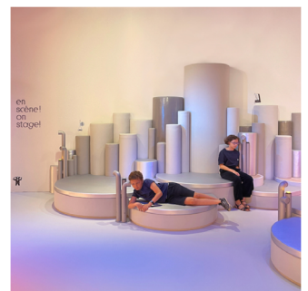
Grande place, Philharmonie des enfants, Constance Guisset Studio