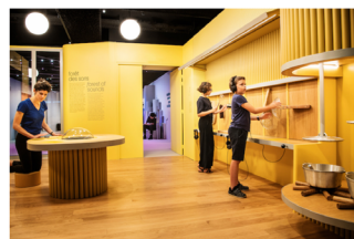
Forêt des sons, Philharmonie des enfants, Constance Guisset Studio