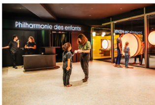
Accueil, Philharmonie des enfants, Constance Guisset Studio