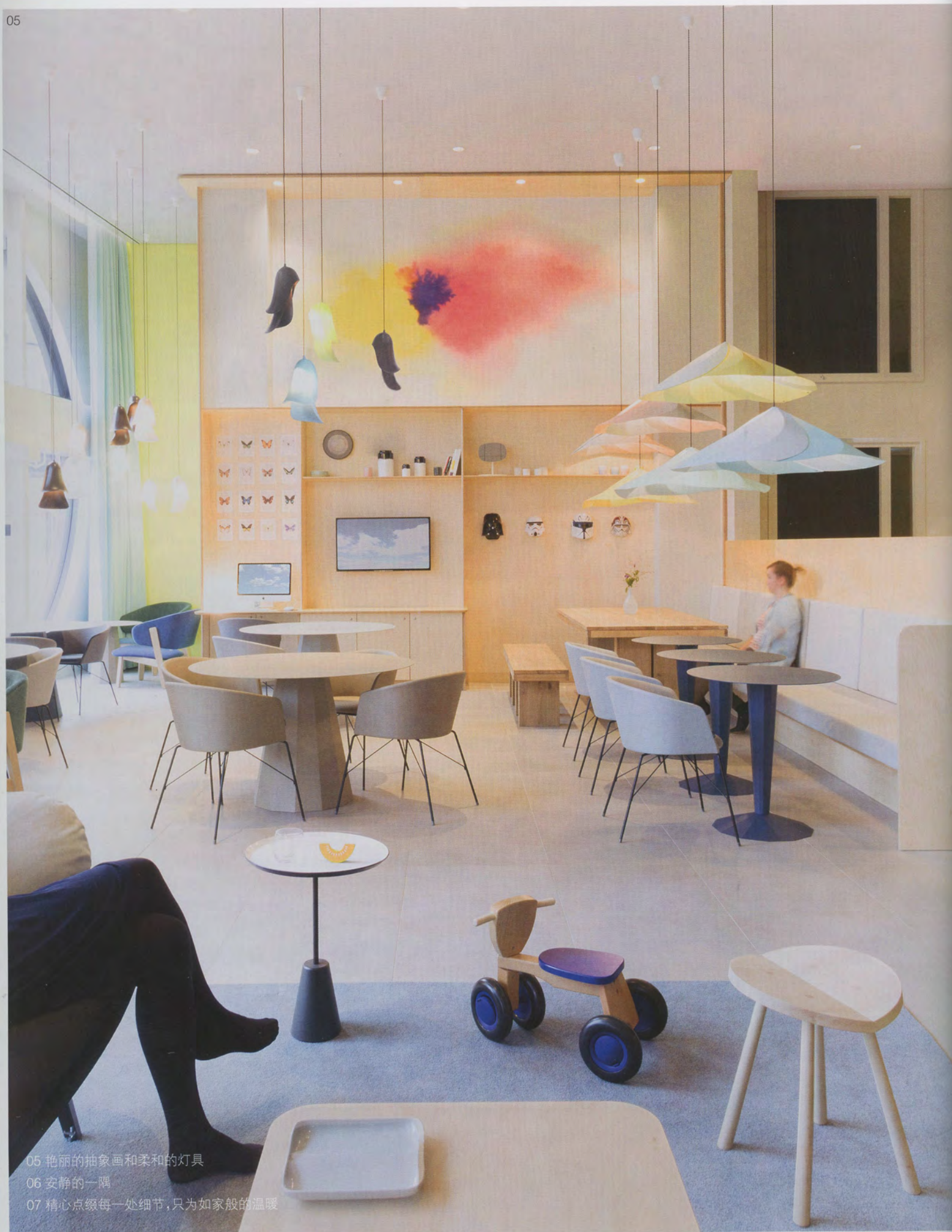
05 艳丽的抽象画和柔和的灯具 06 安静的一隅 07 精心点缀每一处细节,只为如家般的温暖