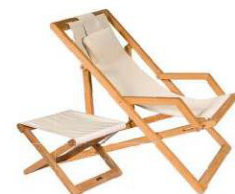
Chilienne et repose-pieds "Copacabana", TECTONA.