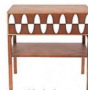
Table de chevet "Ecailles", MAISON SARAH LAVOINE.