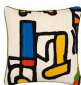
Coussin "Nikita" aux motifs brodés, PIERRE FREY.