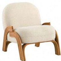
Fauteuil "Bouclette", BALZAC PARIS X LA REDOUTE INTÉRIEURS.

Taniya Molskoye ; Laurent Paraculi ; Massimo Gardone ; Jean-Baptiste Guillon ; Francis Amiard ; Christophe Lombas ; Frank Hülshöbner ; presse