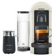
Mousseur à lait "Barista" connecté et machine à café "Vertuo Plus", NESPRESSO.