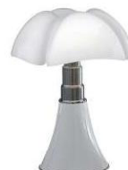
Lampe "Pipistrello Medio", design Gae Aulenti, MARTINELLI LUCE.