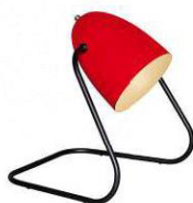
Lampe à poser, design Michel Mortier, SAMMODE.