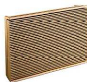
Enceinte Wi-Fi portable "Beosound Level", BANG & OLUFSEN.