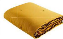
Couvre-lit matelassé "Corlina", MADURA.