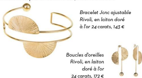
Bracelet Junc ajustable Rivoli, en laiton doré à l'or 24 carats, 143 €

D'influence constructiviste, la collection Rivoli joue avec la sophistication épurée des Parisiennes. Ces bijoux, dont la base est en laiton, ont reçu une couche d'or 24 carats de 0,5 micron d'épaisseur et sont fabriqués à la main à Paris, Médecine Douce.