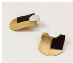
Boucles d'oreilles Rotonde, Art déco, en pierre et laque, 72 €

Broche Coupole , en laiton, pierre et laque noire, qui s'inspire du métissage architectural au Vietnam durant la période Art déco, 47 €