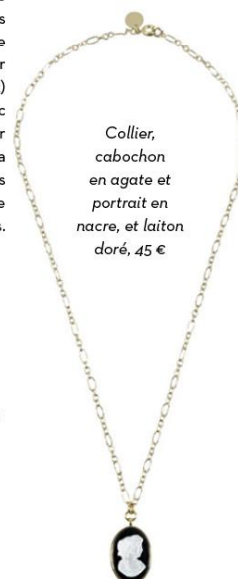
Collier, cabochon en agate et portrait en nacre, et laiton doré, 45 €

Les bijoux sont disponibles dans les boutiques des musées concernés et sur le e-shop boutiquesdemusees.fr