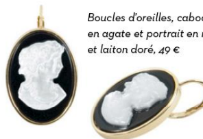
Boucles d'oreilles, cabochon en agate et portrait en nacre, et laiton doré, 49 €