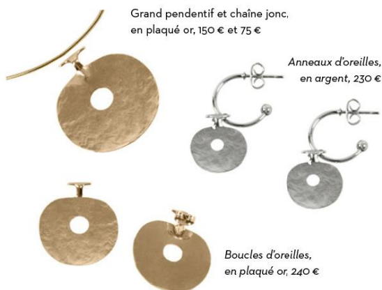
Grand pendentif et chaîne. en plaqué or, 150 € et 75 €

Inspiré d'une pendeloque circulaire du royaume de Lydie (800-500 ans av. J.-C. - Sardes, en Turquie), le « lydien » se décline en collier et boucles d'oreilles, plaqué or ou en argent (fabrication française).