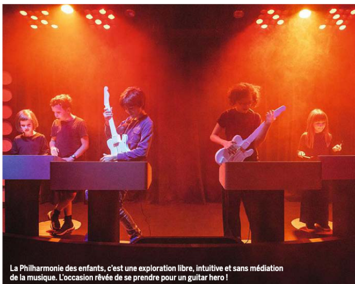
La Philharmonie des enfants, c'est une exploration libre, intuitive et sans médiation de la musique. L'occasion rêvée de se prendre pour un guitar hero !

Ça vous dirait un karaoké du «bled» ? Entre vieilles Peugeot, cassettes audio et décors de cités HLM, l'exposition ludique «Douce France – Des musiques de l'exil aux cultures urbaines», au musée des Arts et Métiers à Paris, nous plonge dans la musique franco-maghrébine des années 1960 à 2000. L'occasion d'une ode à Rachid Taha, disparu en 2018 : rock the casbah ! Jusqu'au 8 mai. arts-et-metiers.net