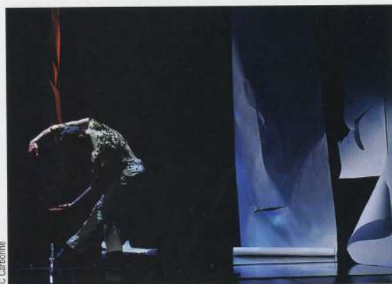
SCÉNOGRAPHIE « LE FUNAMBULE » Ballet Prejocaj, Pavillon noir, 2009.