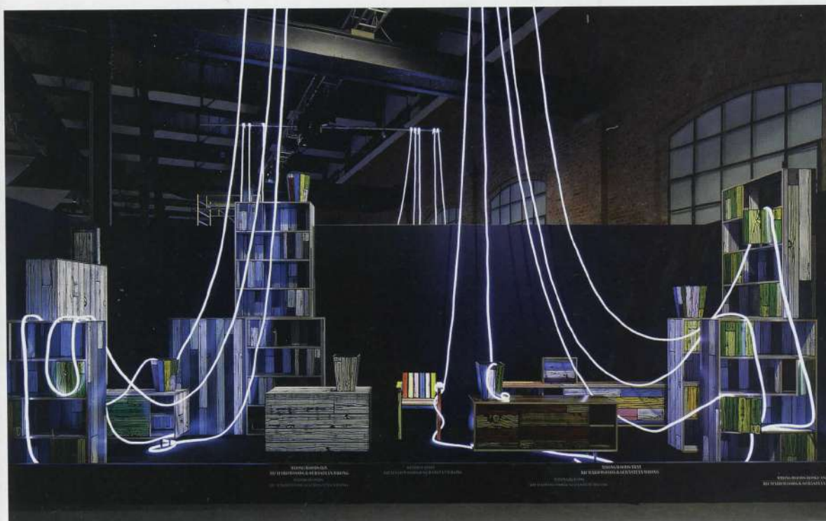
SCÉNOGRAPHIE « STAND ESTABLISHED & SONS » Salon du meuble de Milan, 2012.