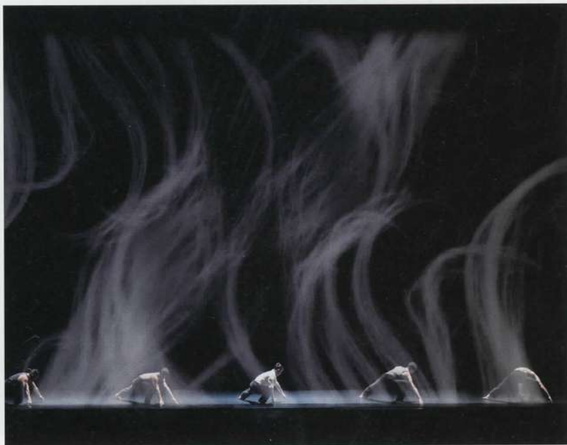
SCÉNOGRAPHIE ET VIDEOS «LA FRESQUE» Ballet Preljocaj, opéra royal du château de Versailles, 2017.