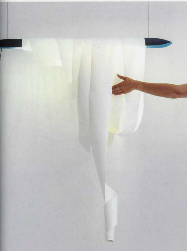
ANGELIN, 2017 Lampe en papier inspirée d'une collaboration avec le chorégraphe Angelin Preljocaj.