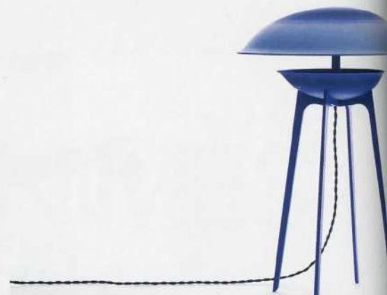
LEVIOSA Suspension réalisée avec le verrier Stéphane Rivoal et la collaboration technique de Grégory Cid. Autoproduction, 2017.

Dessus-Dessous et Dessous-Dessus (éd. Cat-Berro, 2012) illustrent le travail de la designer sur l'optique. Ce duo de luminaires est constitué de deux cercles de céramique inversés teintés en bleu de Sèvres. « Le motif résulte d'une recherche d'affleurement de la couleur, précise-t-elle; un