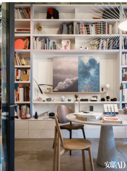
Constance Guisset的办公室,其中呈现着她的诸多标志性设计作品,包括Pleuron靠背椅(后)、Lepida靠背椅(前)与Vertigo吊灯等等。