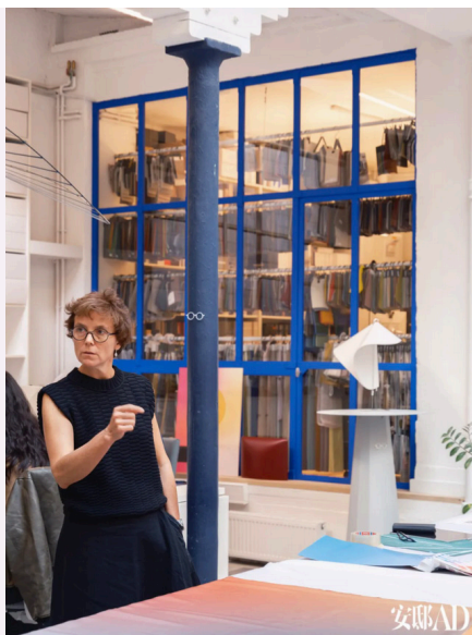
法国设计师Constance Guisset, 2009年在巴黎创立个人工作室,专注于产品设计、室内空间与场景布置三大领域。她的作品强调在人体工学、轻盈感与想象力之间寻找诗意平衡,她善于以出人意料的方式呈现运动的可视化,将功能性 with 情感体验融为一体,始终关注身体的舒适与空间的可塑性。

第四届巴黎 FAB 美术与古董艺博会于今日正式开幕,抢先开启了巴黎秋季艺术季的序幕。此时巴黎大皇宫(Grand Palais)里汇聚了全球100家殿堂级艺术与古董商,呈现横跨艺术、家具、古董、珠宝等20余个领域的珍品。本届艺博会如何看?有哪些重磅收藏品?专业的艺廊们带来了哪些收藏级设计,他们又看到了哪些收藏新趋势……这一切,让我们先从法国知名设计师康斯坦斯·吉塞(Constance Guisset)为本届艺博会设计的拱门说起。