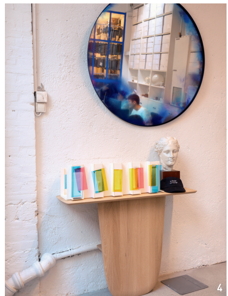
本页 1.Constance Guisset正在和团队沟通工作。2.她接受来自第四届巴黎美术与古董艺博会 (FAB Paris) 的邀约,以独到美学回应大皇宫新艺术风格 (Art Nouveau) 建筑的历史气质。3~4.美好而不失奇异的各类物品映射出工作室多姿多彩的灵感世界。 对页 工作室中的光影流动,丰富多样的色彩、材质、几何形状与设计作品散布于空间各处,空间内曲直相倚,仿佛述说着幽默活泼与严谨细致的创意之道。

这一次,她接受来自第四届巴黎美术与古董艺博会 (FAB Paris) 的邀约,2025年秋,来自全球的100家艺术、设计与古董商,汇聚于大皇宫(Grand Palais)的标志性玻璃穹顶之下,她以独到美学回应大皇宫新艺术风格 (Art Nouveau) 建筑的历史气质,也诠释了展览的一个重要议题——女性艺术家对法国艺术与设计领域的持久影响。“想到大皇宫,我无法不面对它的恢宏。在里边儿迷路是一件常常会发生的事情。尺度上的处理是最大的挑战。”Constance Guisset说道。她来这儿观看过许多展览,在她的感受中,这些展览通常在水平维度上大面积铺展,而缺乏垂直维度上的“向上生长”。Constance Guisset在场景设计中运用拱门作为各区域展览的出入口以及相互衔接的通道,补充了垂直维度的空白。“拱门的线条与大皇宫本身的建筑结构相呼应。我总是抬头仰望大皇宫那富有力量的拱顶线条。我希望通过设计找到历史与当下的交汇。”与此同时,Constance Guisset为场景设计的主视觉注入了鲜亮的颜色,诸如宝蓝、柠檬黄、荧光粉,为古董与中古展品打造出当代的背景。